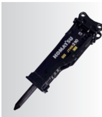
Kraftigt hus Extremt tåligt och slitage-resistent hus – på varje enskild modell!