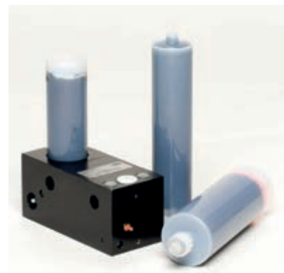
Automatisk smörjning som tillval Ger kontinuerlig smörjning, vilket förlänger livstiden på bussningar och verktyg och därmed skyddar din investering