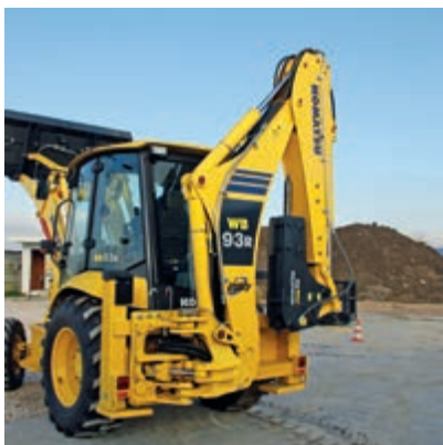
JTHB50WB-3 Särskilt utformad för WB93/97